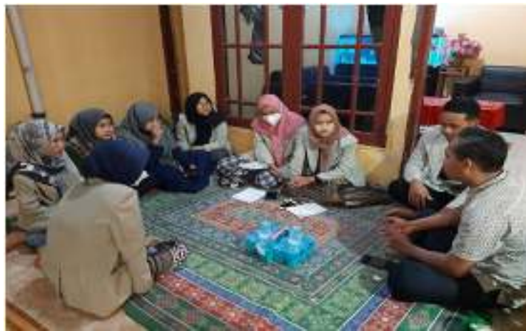
Gambar 1. Observasi ke Ketua BUMDes Kertomas

Kertomas, apakah sudah berjalan atau sebaliknya. Selain itu mencari penyebab masalah unit-unit usaha BUMDes Kertomas tidak berjalan, cenderung mengalami kegagalan