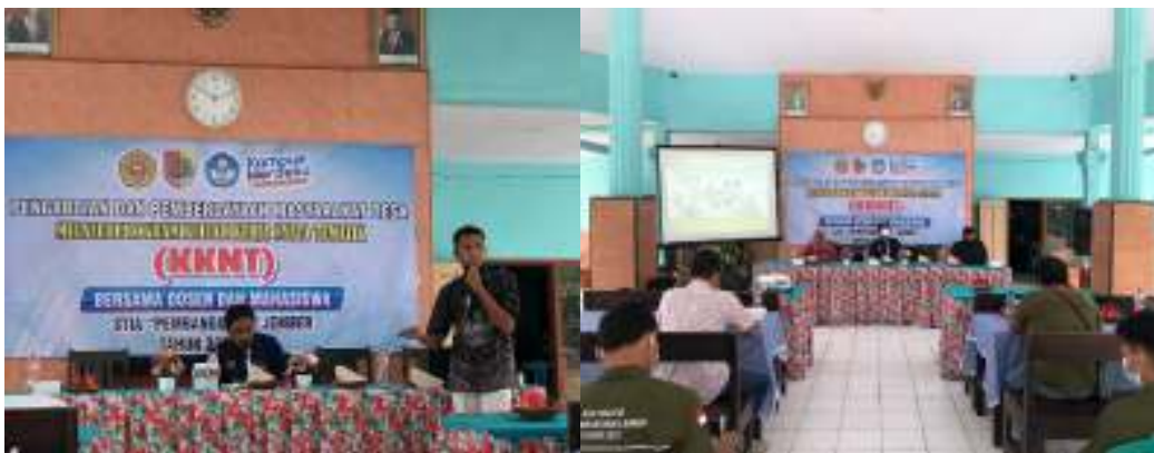
Gambar 4. Sosialisasi peran Pemerintah Desa Dalam Pengelolaan BUMDes

Ancaman (Threat) atau lebih dikenal dengan analisis SWOT. Hal ini bertujuan untuk sebagai bahan masukan pada saat pelaksanaan sosialisasi (Rohim, Asmuni, Muttaqin, 2021).