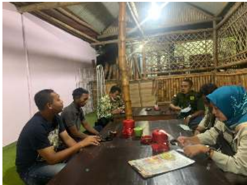
Gambar 5. Diskusi revitalisasi BUMDes dengan salah satu perangkat Desa dan pengurus BUMDes Kertomas.

di Rumah Makan Sate Umar Kertonegoro yang merupakan salah satu UMKM yang ada di desa Kertonegoro. Pelaksanaan ini secara informal agar pengurus BUMDes bisa lebih terbuka dengan permasalahan yang dihadapi oleh BUMDes Kertomas. Kami mendapatkan beberapa alternatif dalam pemecahan masalah yang dialami oleh BUMDes Kertomas.