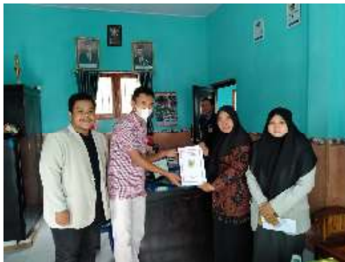
Gambar 6. Penyerahan rekomendasi unit usaha ke Pemdes Kertonegoro

BUMDes Kertomas bisa menjadi maju dan memberikan kesejahteraan kepada masyarakat sekitar serta memberikan sumber alternatif baru Pendapatan Asli Desa (PADes) Kertonegoro.