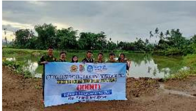
Gambar 2. Observasi potensi desa Kertonegoro